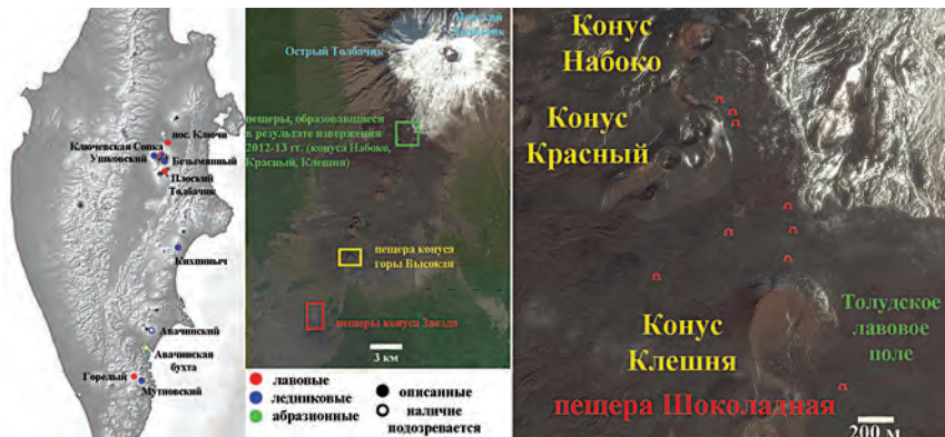
ис. 1. Расположение пещер Камчатки

Ситуация резко изменилась после мощного Трещинного Толбачинского извержения, начавшегося 27 ноября 2012 г. и продолжавшегося более 9 месяцев. Общая площадь сложнопостроенного лавового поля, состоящего из переслаивания многочисленных потоков типа «аа» и «пахойхой» трахиандезитобазальтового состава, достигла 40 км 2 , а объем – около 0,7 км 3 при максимальной толщине лавовых наслоений до 70 м [8, 9]. Начиная с июня 2014 г., сотрудниками Института вулканологии и сейсмологии ДВО РАН, Института геологии рудных месторождений РАН и спелеологами России, Украины и Белоруссии проведены несколько экспедиций на лавовые поля извержения 2012–13 годов, в результате которых были найдены и исследованы 9 новообразованных вулканических пещер (рис. 1) [10].