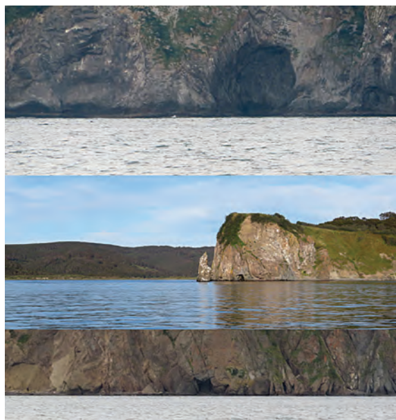
Рис. 6. Абразионные ниши и гроты, трещины в прибрежных скалах Авачинской бухты

Предлагается разделить часть территории Восточной Камчатки на 4 спелеорайона: Центрально-Камчатский (охватывает территорию Центрально-Камчатской депрессии между реками Камчаткой, Хапицей и Толбачик), Южно-Кроноцкий (с границами между Кроноцким заливом, рекой и озером и рекой Жупановой), Северо-Авачинский (между реками Жупановой, Авачей и северной частью Авачинского залива) и Вилючинский (территория горных массивов между реками Авачей и Асачей, исключая Ганальский хребет, и южной частью Авачинского залива).