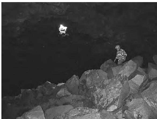
Рис. 4. Обвалный зал с входом в потолке