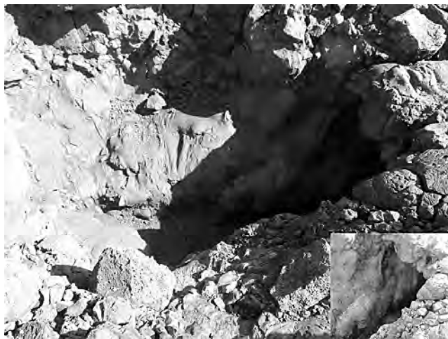
Рис. 2. Вход в пещеру Шоколадная

Исследованная нами пещера Шоколадная (рис. 2) является самой южной и удаленной полостью последней группы. Она расположена к востоку от конуса Клешня в северо-западной части Толудского лавового поля (рис. 1) [11].