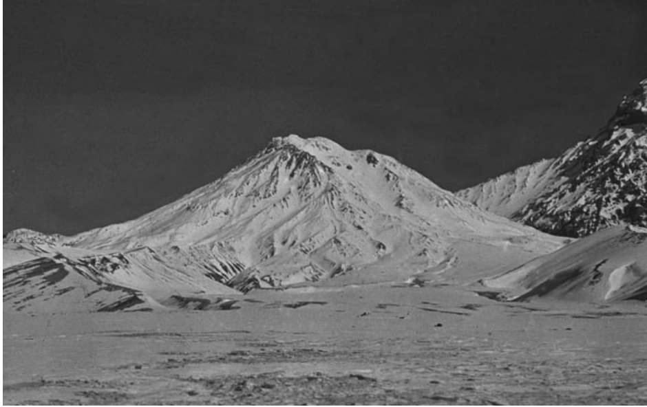
Вулкан Безымянный до извержения 1956 г. Вид с востока.