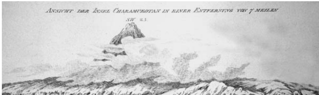
Первое изображение вулкана Харимкотан. Рисунок выполнен в 1805 г. художником Тиллезиусом — участником кругосветного путешествия капитана Крузенштерна.