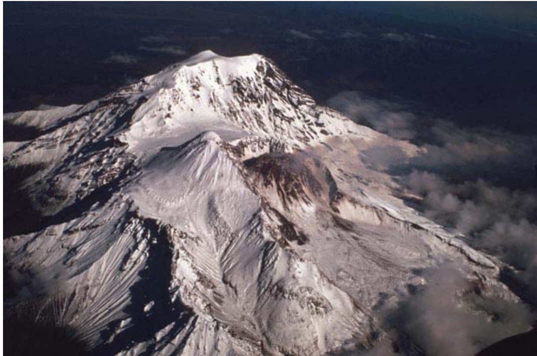
Вулкан Шивелуч. Вид с вертолета, 1994 г. В подковообразном кратере 1964 г. на вершине Молодого Шивелуча расположен купол, сформировавшийся в 1993—1994 гг. На заднем плане — постройка Старого Шивелуча.

на станционного коня по кличке Шивелуч и ответил, что тот, как ему и полагается, пасется. В разговоре наступила долгая пауза, извержение к этому моменту закончилось. Эта история объясняет, почему при восстановлении событий пароксизма 12 ноября нам пришлось пользоваться, как и в предыдущих случаях, свидетельствами случайных наблюдателей, опубликованными Б.И.Пийпом и Е.К.Мархининым 10 .