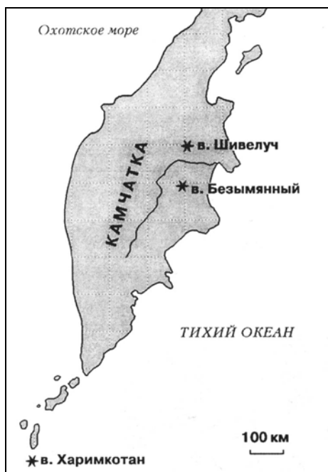
Схема расположения вулканов-объектов исследования.

длительный процесс медленного выжимания купола вязкой лавы среднего состава (60—64% SiO 2 ).