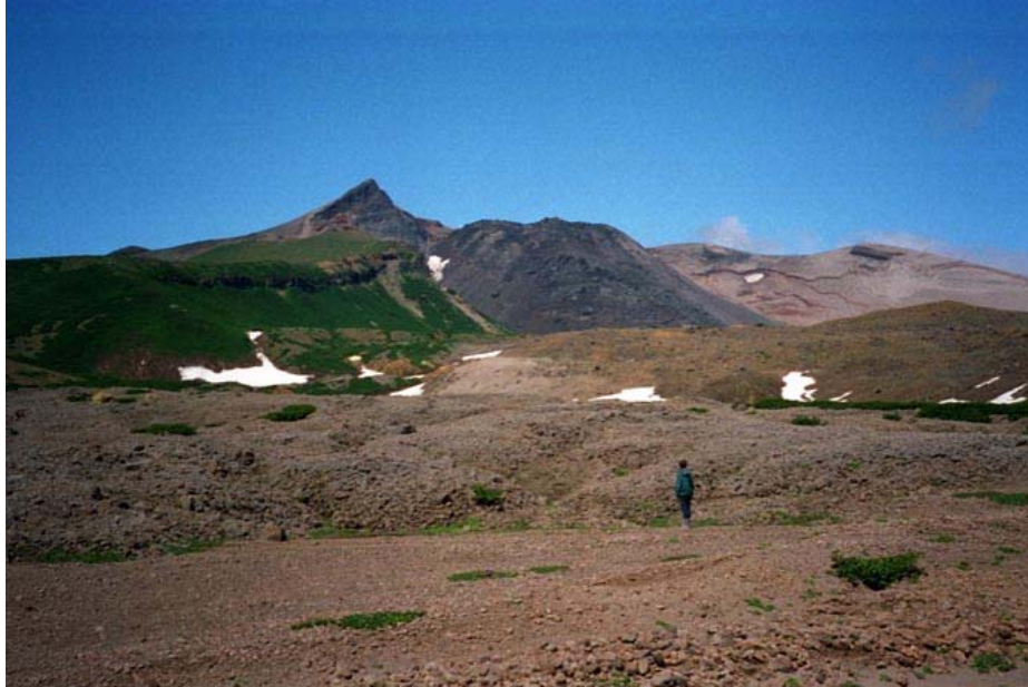
Вулкан Харимкотан. Вид с востока, 1994 г. Подковообразный кратер, образовавшийся и 1933 г., после извержения был частично заполнен куполом (черного цвета). На переднем плане — отложения пирокластического потока 1933 г.

текущий из кратера». Завершало пароксизм плининское извержение, продолжавшееся до 13 января. "Дождь из камней" — куски пемзы, выпадавшие на землю из тучи извержения — покрыл северную половину острова чехлом бомб и лапилли толщиной до 1 м. После пароксизма высота вулкана уменьшилась с 1213 м до 1145 м, и в новом подковообразном кратере диа-