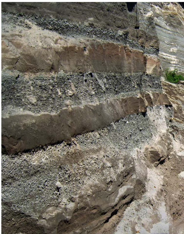
Рис. 1. Обнажение пачки грубой базальтовой пирокластики в юго-западной части вулкана Шивелуч (правый борт реки Байдарной). Видны три слоя, чередующиеся со слоями тонких пеплов. Мощность нижнего слоя составляет 2-2,5 м.

Тефры были детально изучены [Волынец и др. 1997], и по характеру их распространения и стратификации было сделано предположение, что центры обоих извержений располагались в прикратерной части постройки Молодого Шивелуча. Эти тефры схожи между собой по ряду минералогических и геохимических признаков: высокомагнезиальные темноцветные минералы близкого состава, высокий магнезиальный номер пород, а также высокие концентрации Cr и Ni. Тем не менее, они имеют и заметные различия: тефра извержения 7600 ^{14}\text{C} л.н. характеризуется обычным набором минералов – \text{Ol} + \text{Cpx} + \text{Pl} – и является средне-калиевой, в то время как тефра извержения 3600 ^{14}\text{C} л.н., кроме упомянутых минералов, содержит небольшие количества флогопита и амфибол, преобладающий в породе и составляющий 15-20% вкрапленников, она относится к высоко-калиевой серии и обогащена по Ba и Rb. Следует отметить, что в коренном залегании голоценовые базальты извержений как 3600 ^{14}\text{C} л.н., так и 7600 ^{14}\text{C} л.н., до сих пор обнаружены не были.